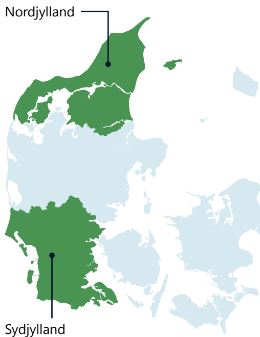
Figur 1. Opdeling af Danmark på NUTS-3 niveau

Nordjylland og Syddjylland er udpeget som støtteberettigede landsdele i forhold til Fonden for Retfærdig Omstilling. Nordjylland er udpeget med udgangspunkt i behovet for omlægning af drivhusgasintensive produktionsprocesser, og Syddjylland er udpeget med udgangspunkt i at afbøde konsekvenserne af udfasning af produktion af fossile brændstoffer i blandt andet Nordsøen. Derfor skal aktiviteter under Fonden for Retfærdig Omstilling som hovedregel gennemføres i Nord- og/eller Syddjylland. I tilfælde af, at aktiviteter foregår i andre landsdele, eller operatører befinder sig i andre landsdele, vil det afgørende være, at effektiviteten sker i Nord- og/eller Syddjylland. Områderne er udpeget på NUTS-3 niveau, hvorfor Syddjylland fx ikke omfatter Fyn.